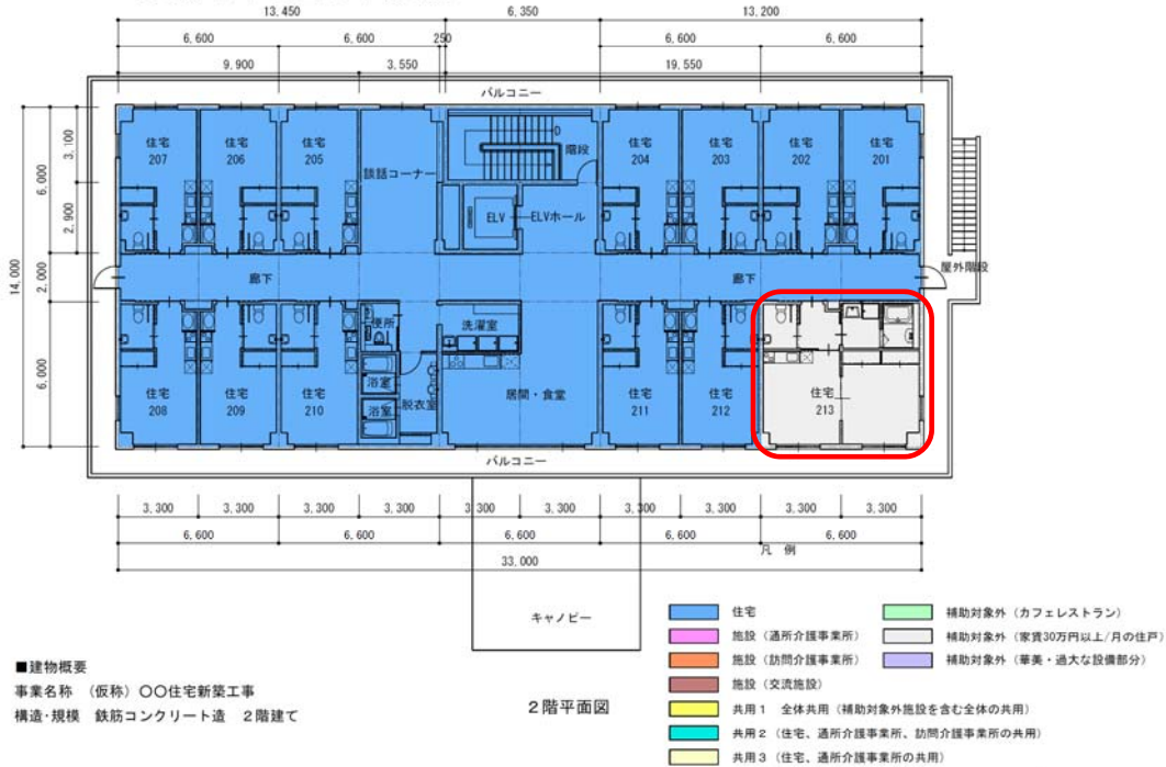
<色分け平面図の作成例>