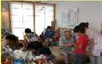
地域交流施設のイメージ